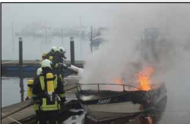
Auslegen von Ölsperren nach Feuer in Großenbrode