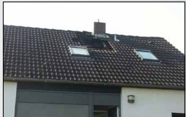
Unterstützung beim Dachstuhlbrand in Neukirchen