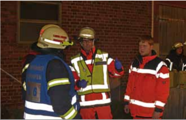
Eine gute Kommunikation mit dem Rettungsdienst