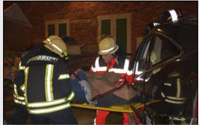
und dem Notarzt ist von entscheidender Bedeutung,