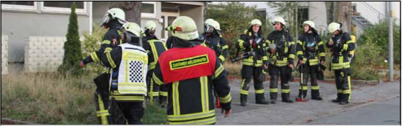
VOR dem Atemschutzeinsatz...