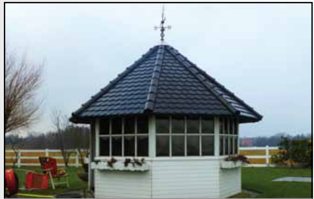
Feuer in einem Gartenpavillon