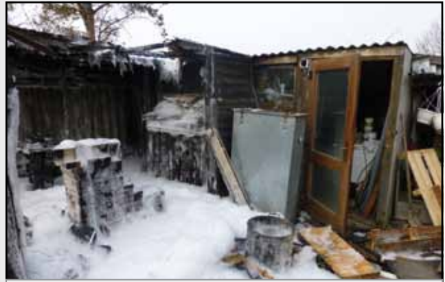
Brand in einer Gartenlaube