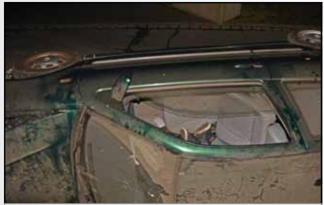
sorgten für ein anspruchsvolles Übungsszenario