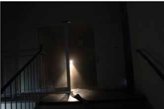
WÄHREND des Atemschutzeinsatzes