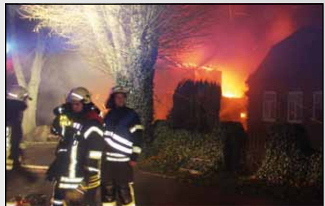
Großfeuer - Wohngebäude gerade noch gerettet