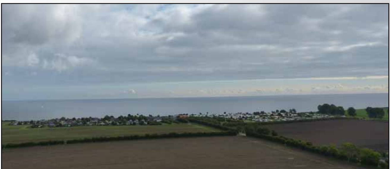
Ausblick aus 45 Metern Höhe über den Campingplatz Kraksdorf

Ein großes DANKESCHÖN an Heinz Meier-Hopp, der für uns seine Windenergieanlage zur Verfügung gestellt hat!