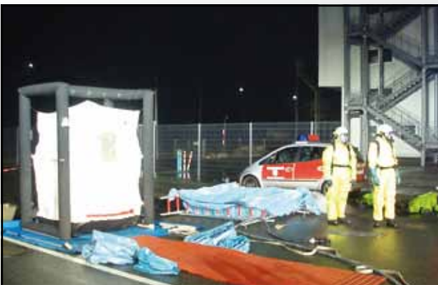
Gefahrguteinsatz im Fährhafen Puttgarden