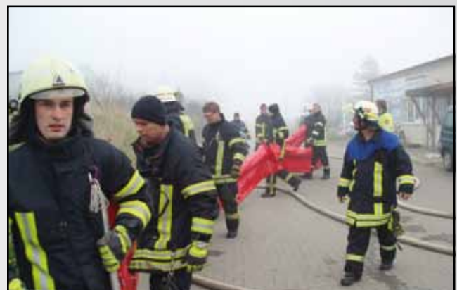
Unterstützung beim Dachstuhlbrand in Neukirchen