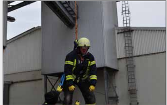
The amazing Spiderman???