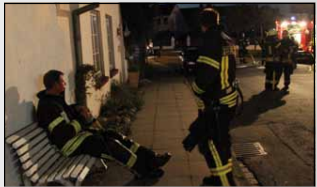
...und ganz offensichtlich DANACH