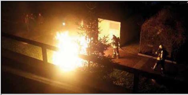
Brennende Müllcontainer auf dem Steinwärd