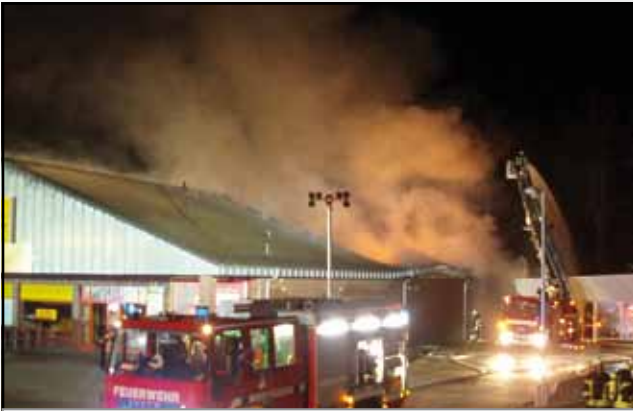
Unterstützung beim Großfeuer in Oldenburg