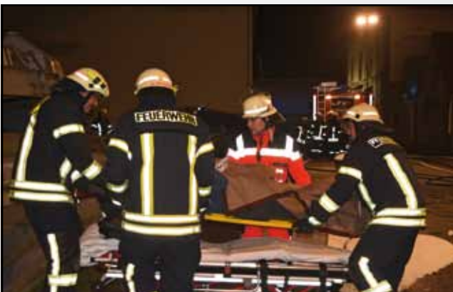
und wird deshalb auch regelmäßig mit den Kollegen