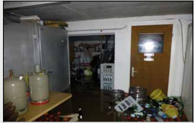
Keller mit Abwasser vollgelaufen