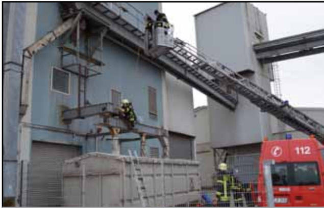
Absturzsicherung mit der Drehleiter