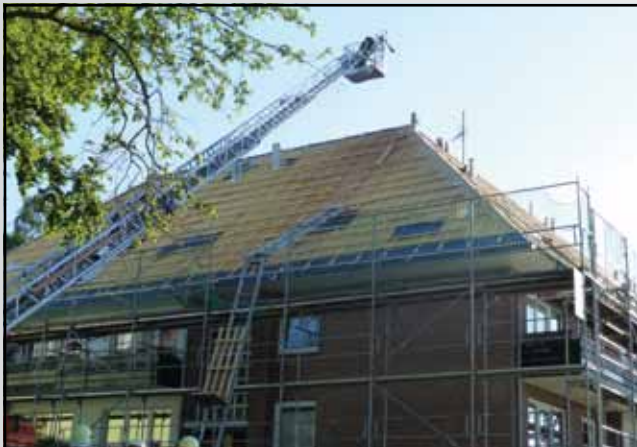
Dachstuhlbrand im Eichholzweg