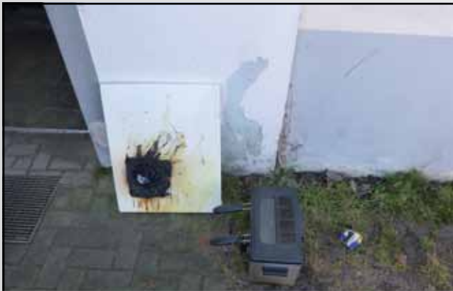
Gerade noch rechtzeitig - brennende Friteuse