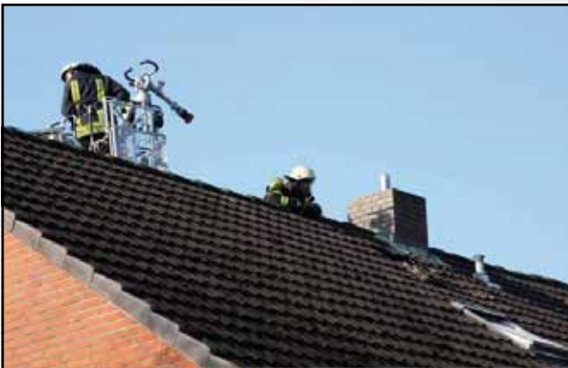
Unterstützung beim Dachstuhlbrand in Neukirchen