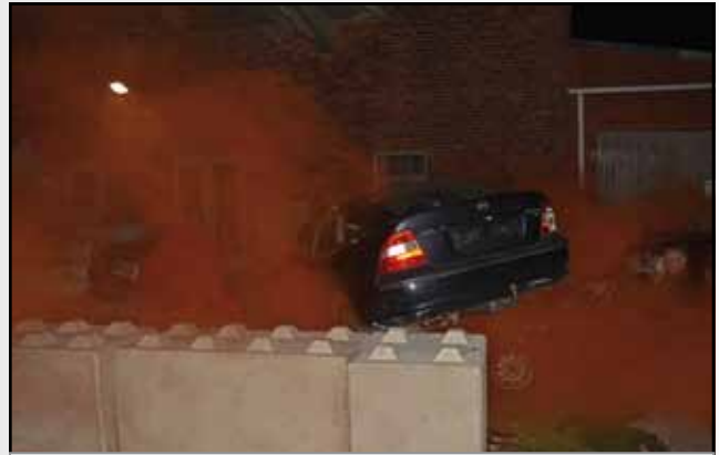
Drei Fahrzeuge in unterschiedlichen Positionen