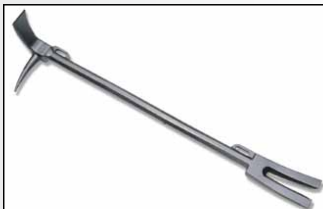
Als „Halligan Tool“ bekanntes Brechwerkzeug