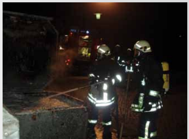
Und das Nervigste zum Schluß: Mülleimer- und Papiercontainerbrände bei Tag und bei Nacht - Zeitverschwendung-