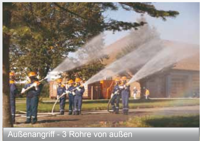
Auenangriff - 3 Rohre von auen