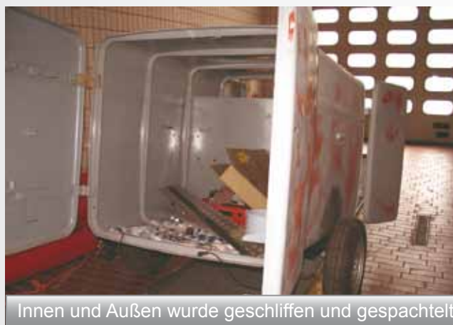
Innen und Außen wurde geschliffen und gespachtelt