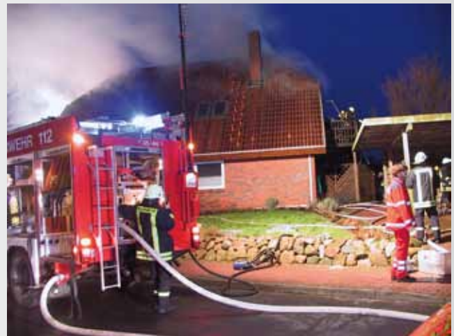
Feuerwehr und Rettungsdienst im Einsatz

Ein Feuerwehrkamerad aus der Nachbargemeinde ist hier intensiv geschult und macht dieses nicht nur für Feuerwehrleute. In Gesprächen wird der Einsatz nachbereitet. Jeder erzählt seine Aufgaben und seine Eindrücke. Es wirkt befreiend, denn schmollen und in sich „hineinfressen“ sollte man nicht. Mit diesen Erfahrungen und Eindrücken kehrt man zurück zu seinen Familien, die natürlich unweigerlich daran teilhaben. Gespräche und die Zeit helfen über solche gewonnenen Eindrücke hinweg, bleiben aber immer im Unterbewusstsein bestehen.