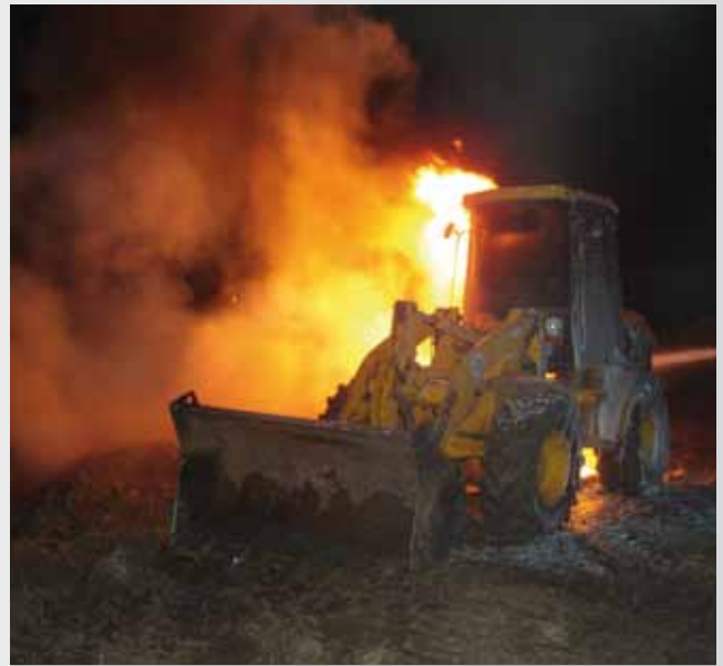
Radladerbrand im Neubaugebiet Grauwisch