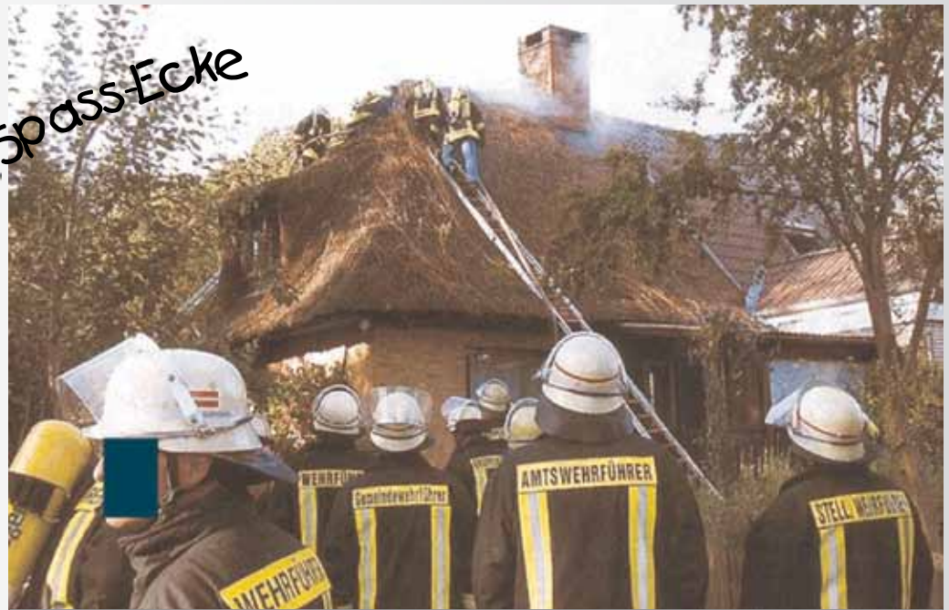
Viele Häuptlinge - wenig Indianer

Und schlagen die Flammen zum Himmel empor, dann hält jeder Ausschau nach Gott und der Feuerwehr... und ist erloschen das Flammenmeer vergisst du Gott und die Feuerwehr!!!!