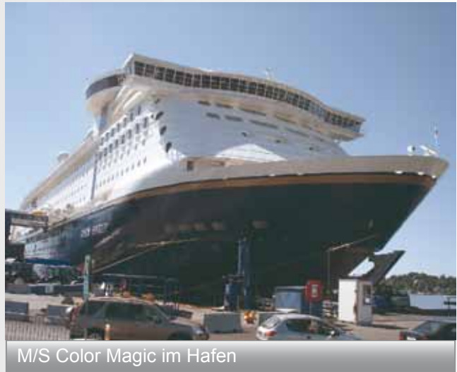
M/S Color Magic im Hafen

Lange Gänge zu den Kabinen und das auf mehreren Decks - da war Verlaufen ein Kinderspiel. Ein starker Wind wehte uns draußen auf dem Sonnendeck um die Ohren. Auf dem Schiff gab es viel zu entdecken, viele verschiedene Angebote wie Shows, Restaurants, Casino, Aqua Landschaften, Bars - da kam keine Langeweile auf. Wie man uns vorher schon verraten hatte, ergatterten wir uns einen der heißbegehrten Plätze in der Observation Lounge auf Deck 15. Von dort aus hatten wir einen phantastischen Blick, um am zweiten Tag, bei strahlendem Sonnenschein und eisiger Kälte durch den