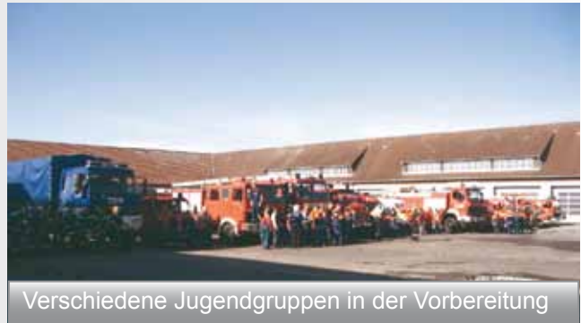
Verschiedene Jugendgruppen in der Vorbereitung

Eine groe Herausforderung fr die Jugendlichen, die den gestellten Aufgaben gerecht wurden. Jeder konnte sein Knnen unter Beweis stellen. Sei es die Einsatzleitung, die Wasserversorgung ber lange Strecken, die Rettung der vermissten Personen und deren Versorgung, die Brandbekmpfung und die technische Hilfe durch das THW. Alle hatten eine Menge zu tun und auch ihren Spa, der neben dem bungsziel auch nicht zu kurz kommen soll. Nach der bung wurde durch das Sozial- und Kulturzentrum der Ameos-Klinik ein Imbiss und Getrnke fr die „erschpften“ Einsatzkrfte gereicht.