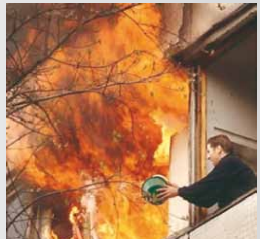
Jeder Löschversuch zählt

Und schlagen die Flammen zum Himmel empor, dann hält jeder Ausschau nach Gott und der Feuerwehr... und ist erloschen das Flammenmeer vergisst du Gott und die Feuerwehr!!!!