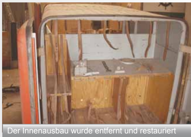
Der Innenausbau wurde entfernt und restauriert