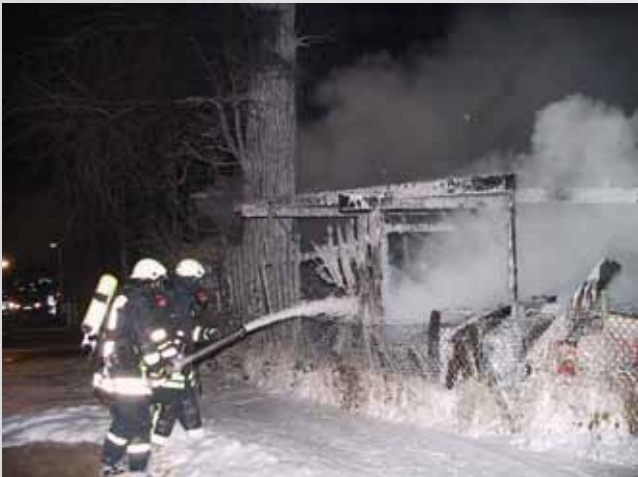
Ein Feuer bei der Segelschule Bennewitz zerstörte einen Bootsschuppen und mehrere Boote.