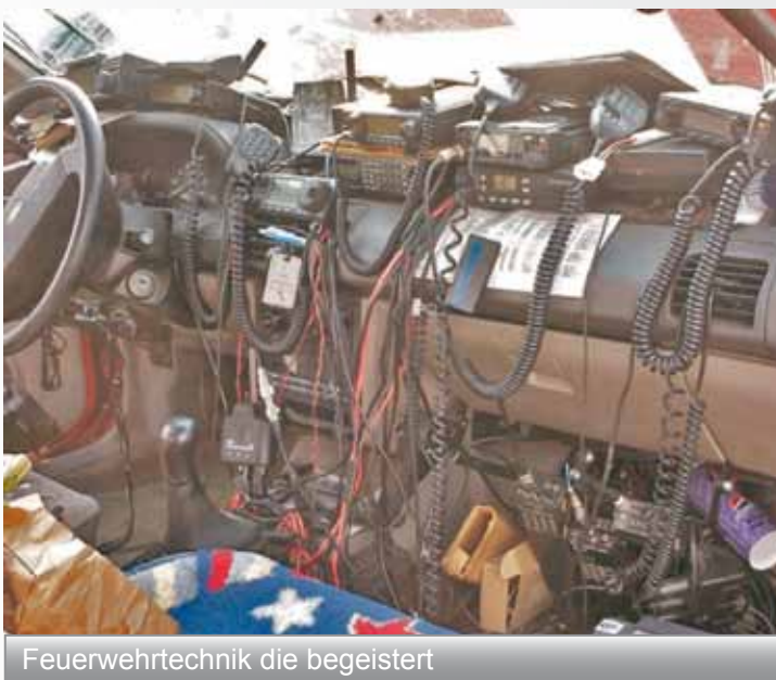
Feuerwehrtechnik die begeistert

...und Gott fragte die Steine: „Wollt Ihr Feuerwehrmänner werden?“ Darauf antworteten die Steine: „NEIN, DAFÜR SIND WIR NICHT HART GENUG!!!“