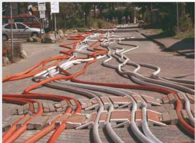
Schlauchlandschaften in den Strassen