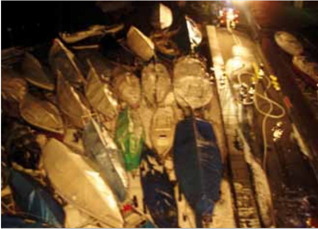
Bootsbrand bei der Werft Götsch: schnelles Eingreifen verhinderte Schlimmeres !