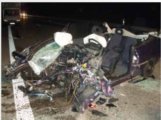
Bei diesem Verkehrsunfall auf der E47 kam für eine junge Frau jede Hilfe zu spät.