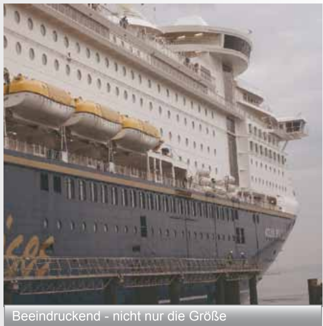
Beeindruckend - nicht nur die Größe