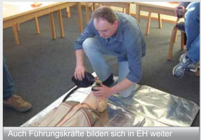
Auch Führungskräfte bilden sich in EH weiter