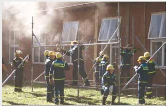
THW-Jugend - Ein eingespieltes Team