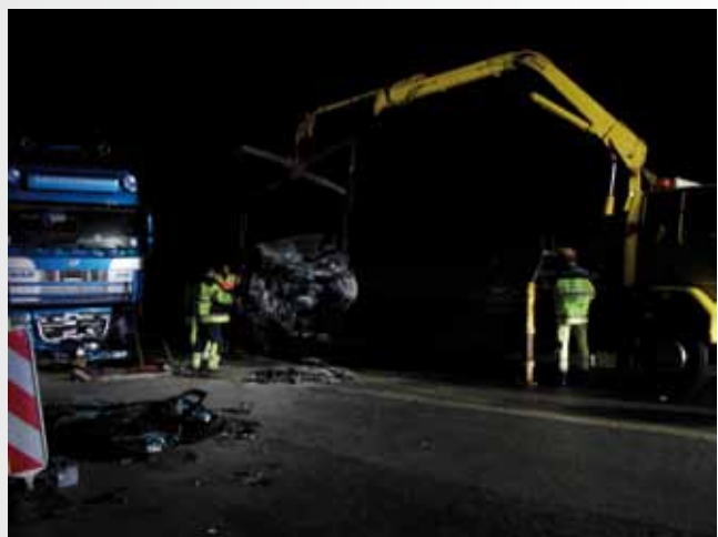
Leider kam für den kleinen Jungen jede Hilfe zu spät !