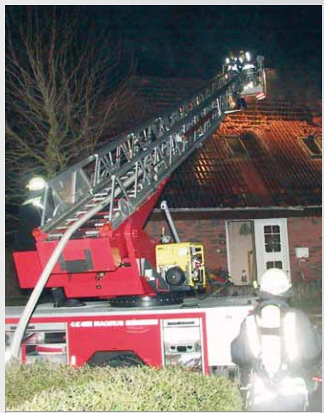
Die Drehleiter - unverzichtbar bei Dachstuhlbränden