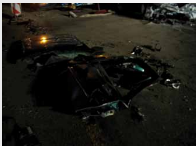
Trümmer werden aufgeräumt - Erinnerungen bleiben