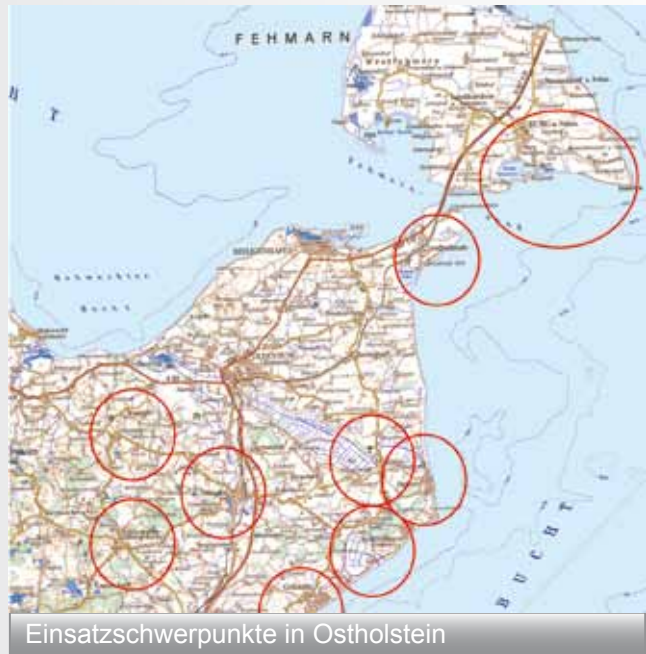
Einsatzschwerpunkte in Ostholstein

Der Einsatz dauerte bis Dienstag, den 14. August. In dieser Zeit wurden ca. 3000 Einsatzkräfte eingesetzt. Allein am Sonnabend waren ca. 1000 Feuerwehrleute gleichzeitig an den verschiedenen Einsatzorten. Im Bereich Grube, Dahme und Grömitz wurden ca. 800 B-Schläuche verlegt. Das sind ungefähr 16 Kilometer. Das THW setzte Hochleistungspumpen ein. Diese