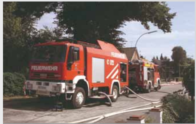
Heiligenhafener TLF 24 in Dahme/Grube im Einsatz

haben eine Pumpenleistung von ca. 15000 Ltr./min. Am Abend nach Einsatzende dauerte das Aufrollen der genutzten Schläuche ca. 2 Stunden. Diese Arbeiten erledigten die Wehren des Amtes Ostholstein Mitte. Die Technische Einsatzleitung war 73 Stunden durchgehend im Einsatz. Durch genügend ausgebildetes Personal konnte Schichtdienst geleistet werden. Das Einsatztagebuch umfasst 42 Seiten, auf 262 Vordrucken wurden Meldungen und Aufträge verarbeitet. Zu den Aufgaben der TEL gehörte es Personal und Material anzufordern, Verpflegung für die Einsatzkräfte zu organisieren, Betriebsstoffe zu den Einsatzorten zu transportieren, dem Stab des Kreises Ostholstein mit allen Informationen zu versorgen.