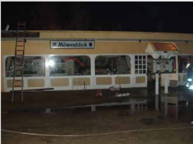
Das Restaurant „Möwenblick“ am Steinwarder wurde durch ein Feuer stark beschädigt.