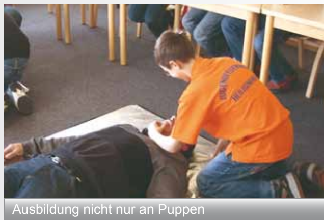
Ausbildung nicht nur an Puppen