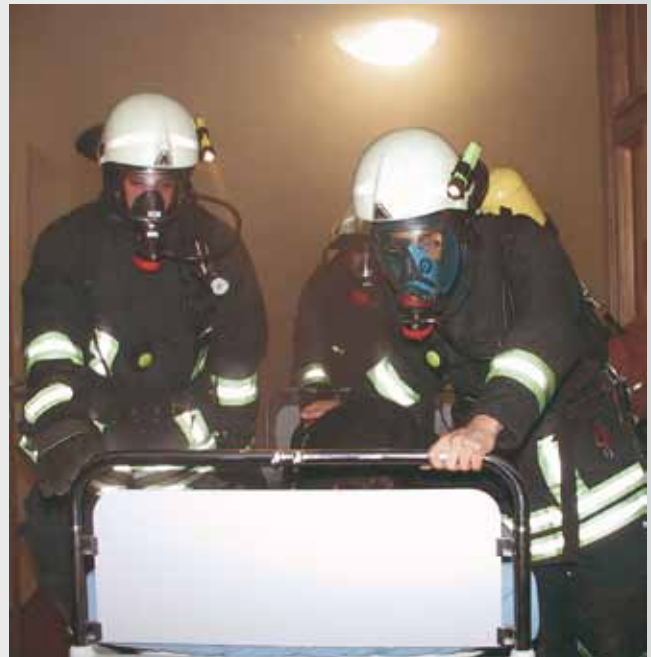
Atemschutzträger bei der Rettung

Bei einer kräftigen Gulaschsuppe wurden die Übung im Festsaal der Klinik nachbesprochen, bevor zu guter Letzt wieder Ruhe auf dem Gelände von AMEOS Psychatrium einkehrte.