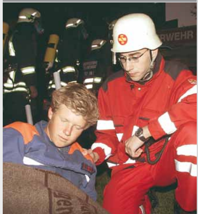
ASB-Helfer versorgen „Patienten“