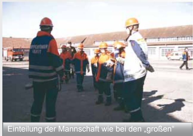
Einteilung der Mannschaft wie bei den „groen“