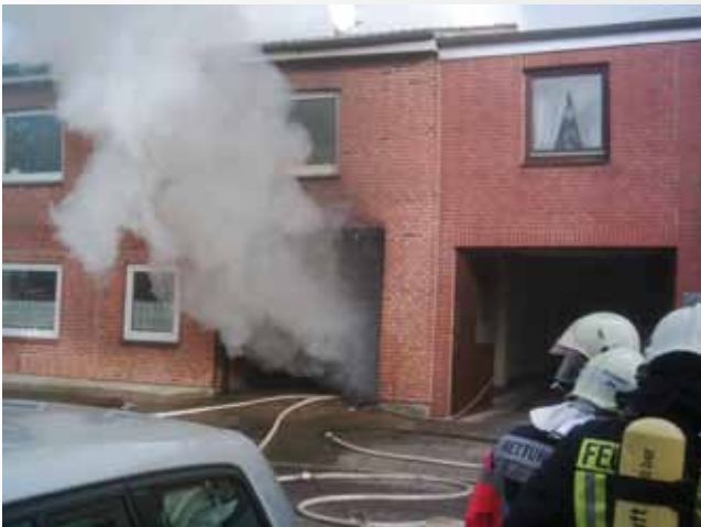
Feuer in Oldenburg: Wie hier in der Burgtorstrasse sind wir des öfteren zur nachbarlichen Löschhilfe in unseren Nachbargemeinden unterwegs.