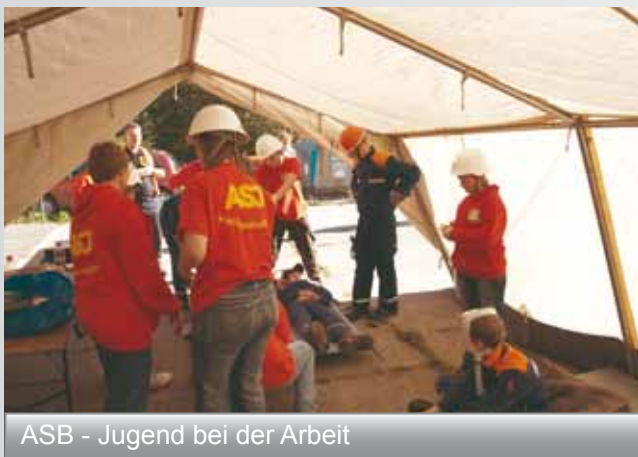
ASB - Jugend bei der Arbeit