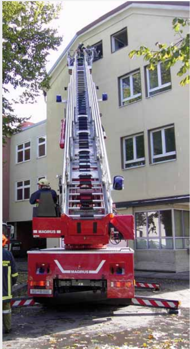
Hauptopfer von Falschbezeichnung: Drehleiter nicht „Leiterwagen“

Zum Schluss werden noch einige Abkürzungen erläutert: WF = Wehrführer, EL = Einsatzleiter, DLK = Drehleiter mit Korb, LF = Löschgruppenfahrzeug, RTW = Rettungswagen, VU = Verkehrsunfall, Hilo = Hilflose Person.