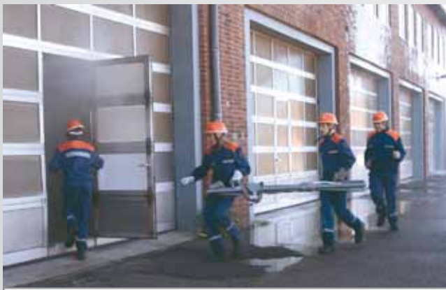
Schnelligkeit - auch bei bungen