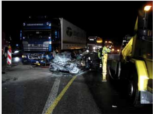
Verkehrsunfall E47 PKW gegen LKW

Am gleichen Tag wurden wir um ca. 16:30Uhr zu einem Wohnhausbrand mit dem Alarmstichwort: